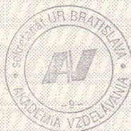
predseda skúšobnej komisie